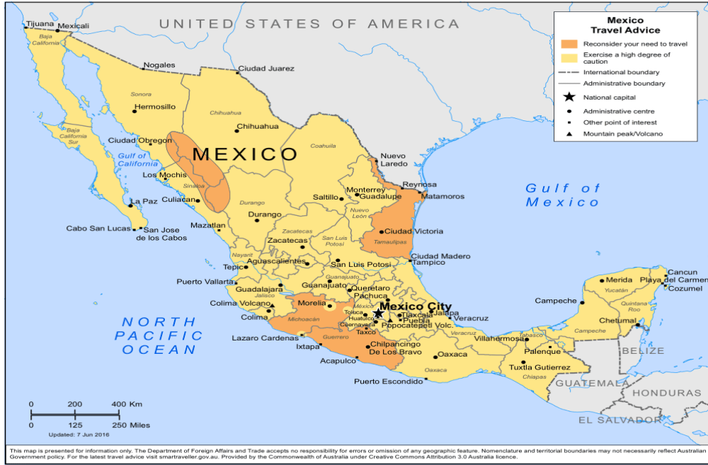
Şekil 1. Meksika'nın coğrafi konumu.